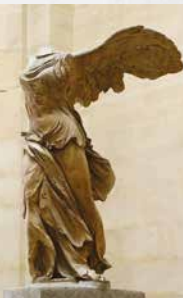
Νίκη της Σαμοθράκης