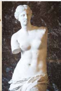
Αφροδίτη της Μήλου

Ετοιμάσου για σκισσομαχία: σκίτσαρε τα παραπάνω 3 έργα τέχνης στην ομάδα σου. Έχεις χρόνο 5 λεπτά. Αν τα βρει η ομάδα σου, προχωρήστε 5 τετράγωνα μπροστά. Αν όχι, πηγαίνετε 3 τετράγωνα πίσω.